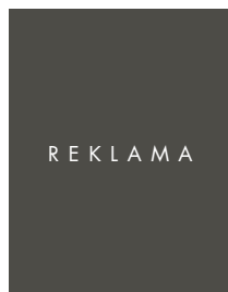
OKŁADKA, 1/1 STRONY

UWAGA! REKLAMY NA ROZKŁADÓWKĘ PRZYJMOWANE SĄ WYŁĄCZNIE W ROZBICIU NA DWIE POJEDYNCZE STRONY, Z PEŁNYMI SPADAMI.