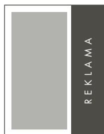
1/3 STRONY PION