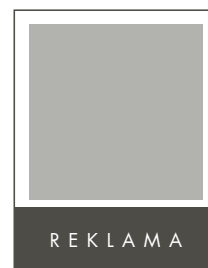
1/4 STRONY POZIOM