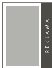
1/4 STRONY PION