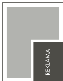
1/4 STRONY KRZYŻ