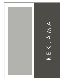
1/2 STRONY PION