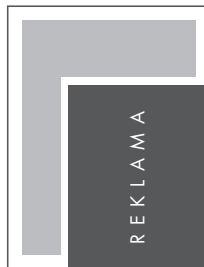
JUNIOR PAGE NETTO: 160 x 201 BRUTTO: 170 x 211