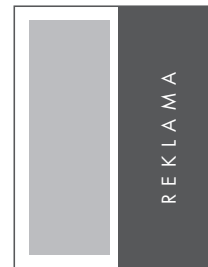
1/2 STRONY PION NETTO: 110 x 285 BRUTTO: 120 x 295