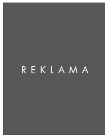
OKŁADKA, 1/1 STRONY NETTO: 225 x 285 BRUTTO: 235 x 295