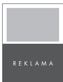
1/2 STRONY POZIOM NETTO: 210 x 136 BRUTTO: 220 x 146