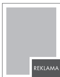
1/8 STRONY NETTO: 101 x 73 BRUTTO: 111 x 83