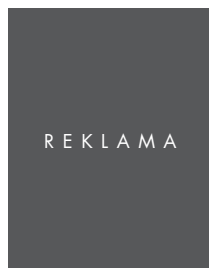
OKŁADKA, 1/1 STRONY NETTO: 210 x 280 BRUTTO: 220 x 290