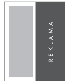
1/2 STRONY PION NETTO: 112 x 285 BRUTTO: 122 x 295