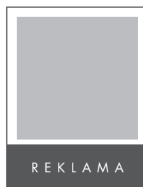
1/4 STRONY POZIOM