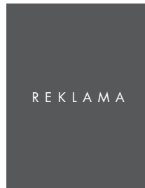
OKŁADKA, 1/1 STRONY NETTO: 225 x 285 BRUTTO: 235 x 295