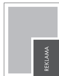
1/4 STRONY KRZYŻ