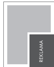
1/4 STRONY KRZYŻ NETTO: 112 x 141 BRUTTO: 122 x 151