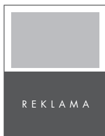
1/2 STRONY POZIOM