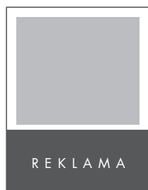
1/3 STRONY POZIOM