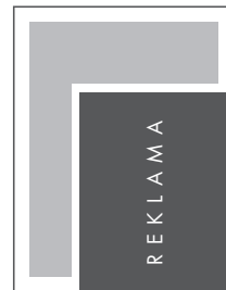
JUNIOR PAGE NETTO: 184 x 198 BRUTTO: 194 x 208