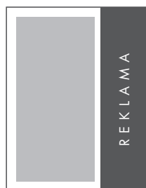
1/3 STRONY PION