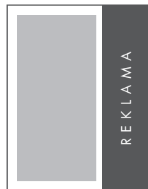
1/3 STRONY PION NETTO: 76 x 285 BRUTTO: 86 x 295