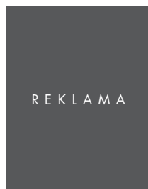
OKŁADKA, 1/1 STRONY