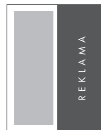
1/2 STRONY PION