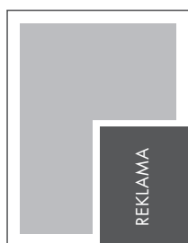
1/4 STRONY KRZYŻ NETTO: 113 x 137 BRUTTO: 123 x 147