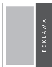
1/3 STRONY PION NETTO: 78 x 285 BRUTTO: 88 x 295