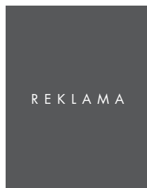
OKŁADKA, 1/1 STRONY NETTO: 225 x 285 BRUTTO: 235 x 295