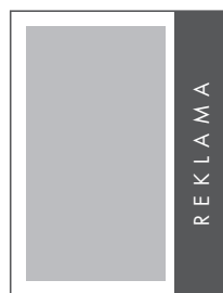
1/4 STRONY PION NETTO: 61 x 285 BRUTTO: 71 x 295