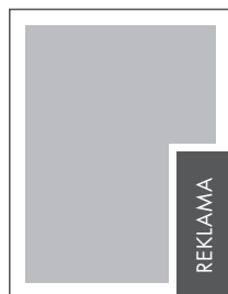
1/8 STRONY PION NETTO: 52 x 140 BRUTTO: 62 x 150