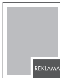
1/8 STRONY NETTO: 105 x 71 BRUTTO: 115 x 81