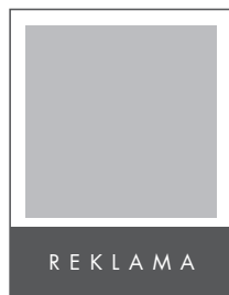
1/4 STRONY POZIOM