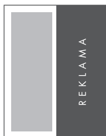
1/2 STRONY PION