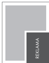
1/4 STRONY KRZYŻ