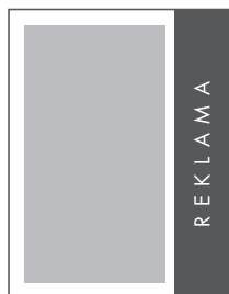
1/4 STRONY PION