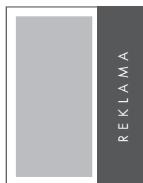
1/3 STRONY PION