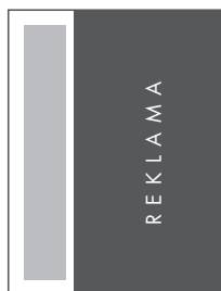
3/4 STRONY PION